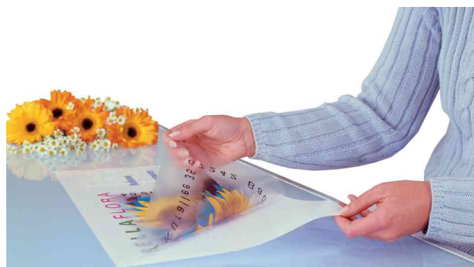
Folienetiketten DIN A3, Anwendung