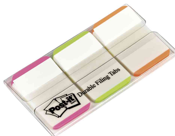
Haftmarker Index Strong, pink/grün/orange