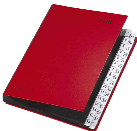
Pultordner Color 1 - 31, rot