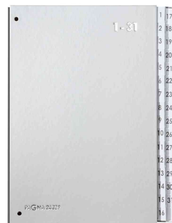
Pultordner Color 1 - 31, silber