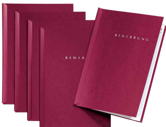
Bewerbungs-Set "Start", rot