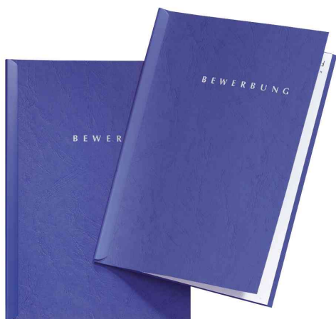
Bewerbungs-Set "Start", blau