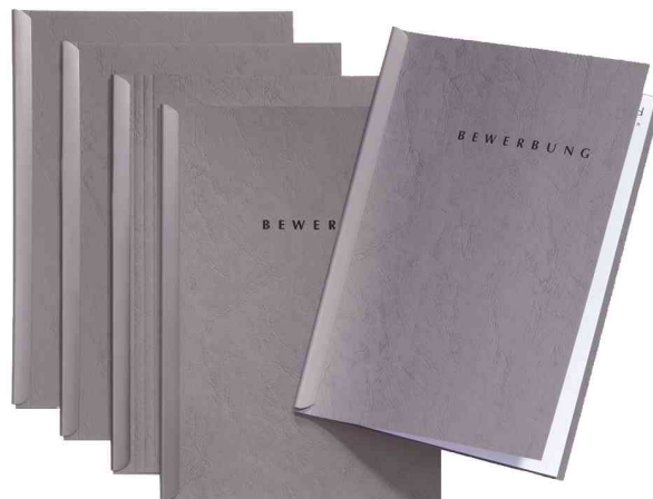
Bewerbungs-Set "Start", grau