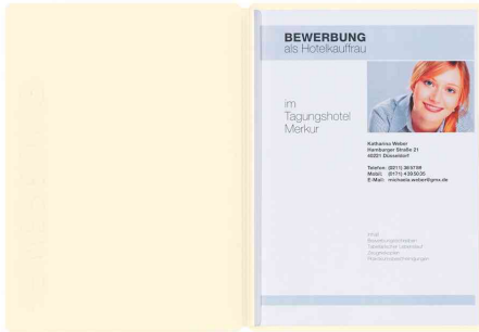
Bewerbungsmappe "Solo", beige