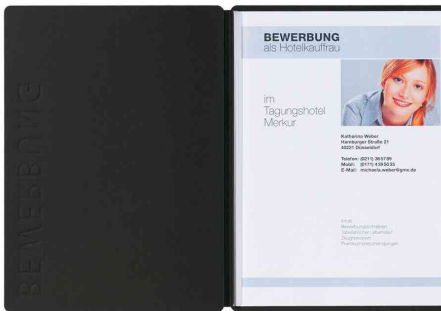
Bewerbungsmappe "Solo", schwarz