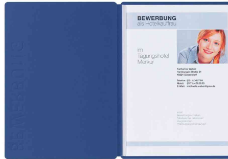
Bewerbungsmappe "Solo", blau