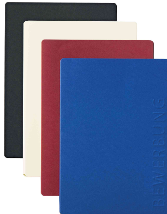
Bewerbungsmappe "Solo", alle Farben