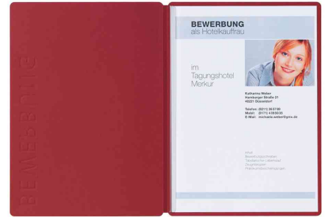
Bewerbungsmappe "Solo", rot