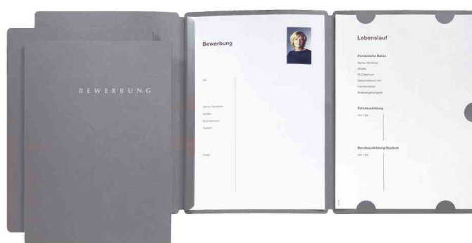
Bewerbungsmappe "Select", grau