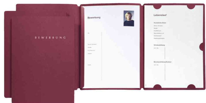
Bewerbungsmappe "Select", rot