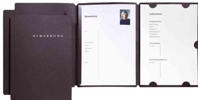
Bewerbungsmappe "Select", schwarz