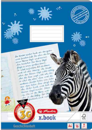
Geschichtenheft x.book, Lineatur: 3G