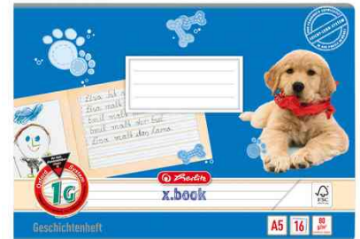
Geschichtenheft x.book, Lineatur: 1G