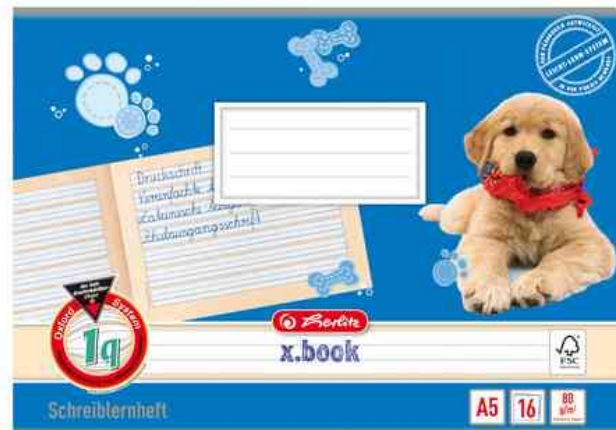
Schreiblernheft x.book, Lineatur 1q