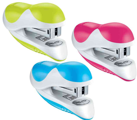
Heftgerät Ergologic Mini