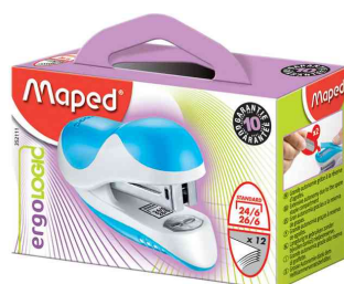
Heftgerät Ergologic Mini, im Karton