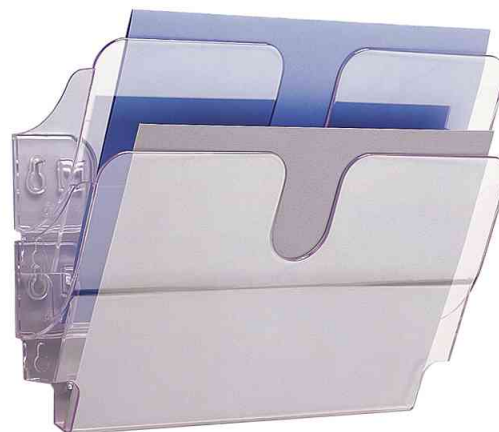
Wand-Prospekthalter "FLEXIPLUS 2", transparent