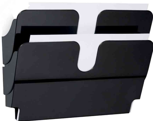
Wand-Prospekthalter "FLEXIPLUS 2", schwarz

- für die übersichtliche Präsentation von Katalogen, Zeitschriften etc.