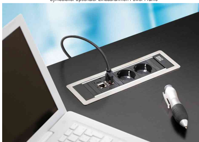
Zeigt das Produkt in der Anwendung