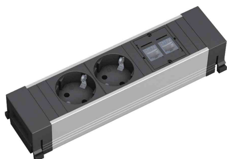
Steckdoseneinheit Power Frame