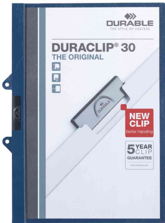
Klemmhefter DURACLIP® 30 EASY FILE