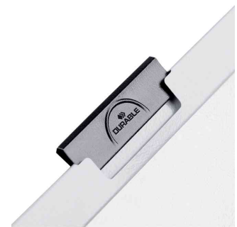
Herausziehbare, schwarze Klemme