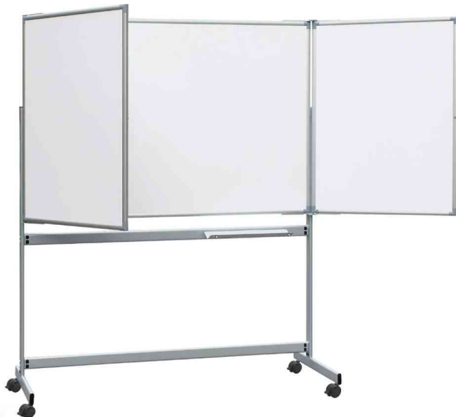
Mobile Weißwand-Klapptafel MAULpro

Tafelgröße 1.000 x 1.500 mm, Flügel jeweils 1.000 x 750 mm. Außenmaß geschlossen: 1.580 x 1.950 x 650 mm