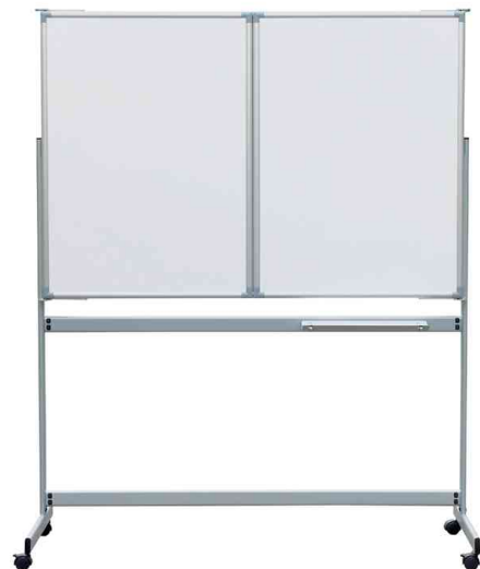
Mobile Weißwand-Klapptafel MAULpro, geschlossen