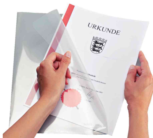
Sichthülle Super Premium, Anwendung