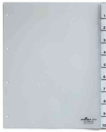
Universal Kunststoff-Register, 10-teilig, A4 überbreit