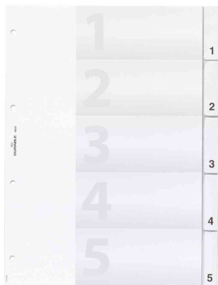
Universal Kunststoff-Register, 5-teilig