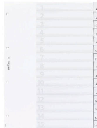
Universal Kunststoff-Register, 15-teilig