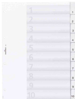
Universal Kunststoff-Register, 10-teilig