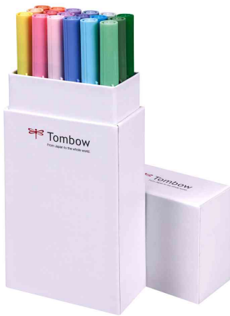
Fasermaler "ABT DUAL BRUSH PEN", 18er-Set Pastellfarben