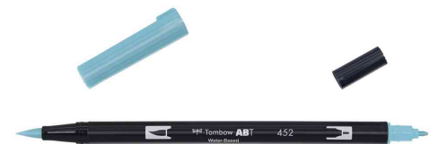
mit 2 Spitzen