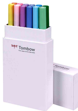
Fasermaler "ABT DUAL BRUSH PEN", 12er-Set Pastellfarben