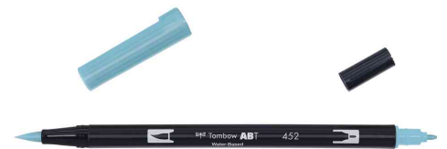
mit 2 Spitzen