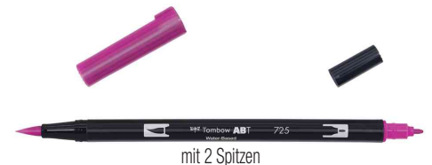
mit 2 Spitzen