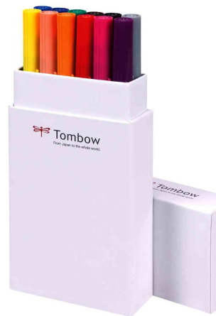
Fasermaler "ABT DUAL BRUSH PEN", 12er-Set Primärfarben