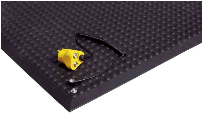
Arbeitsplatzmatte Yoga Ergo Fusion