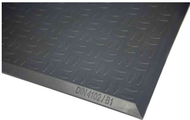
Arbeitsplatzmatte Yoga Ergo Fire, Riffelprofil