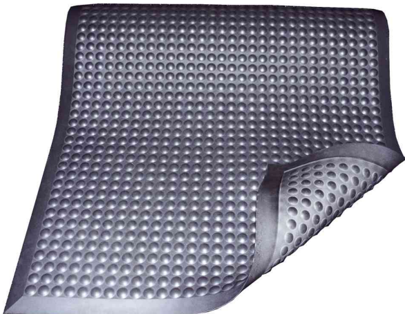
Arbeitsplatzmatte Yoga Ergo Fire