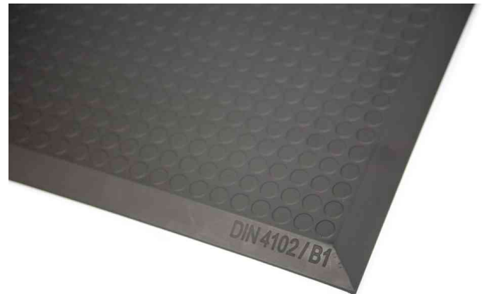
Arbeitsplatzmatte Yoga Ergo Fire, Flachnuppenprofil