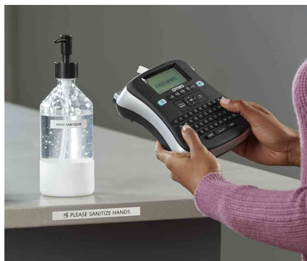
Tisch-Beschriftungsgerät "LabelManager 210D+"