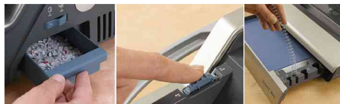
Schnipselbehälter - einstellbarer Randanschlag - ausziehbares Ablagefach mit Messvorrichtung