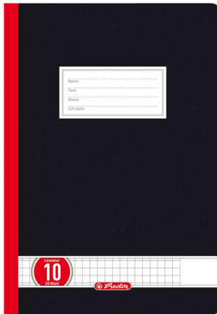
Oberschulheft x.book, kariert