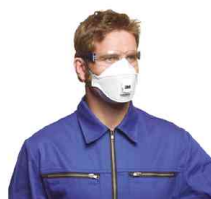
Atemschutzmaske Serie 9300, Innovatives Filtermedium - 3-teiliges Design - Cool-Flow-Ausatemventil