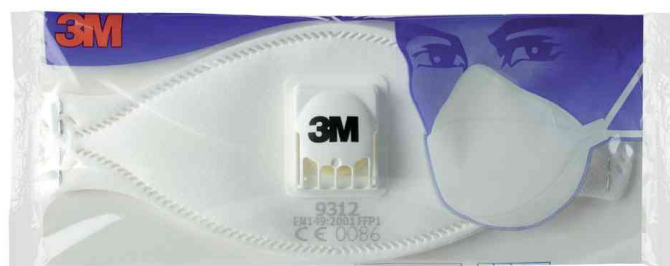
Atemschutzmaske Serie 9300, Einzelverpackung