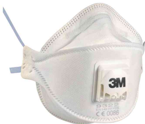
Atemschutzmaske Serie 9300

Tipp! Optimal für Brillenträger! Ideal mit 3M Schutzbrillen kombinierbar.