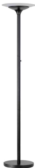
LED-Stehleuchte VARIAGLASS, schwarz