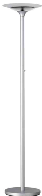
LED-Stehleuchte VARIAGLASS, metallgrau