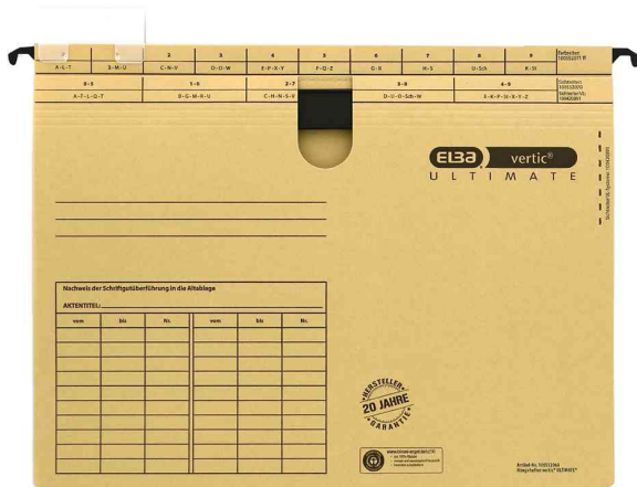
Hängehefter ELBA vertic ULTIMATE, BZ-Hefter