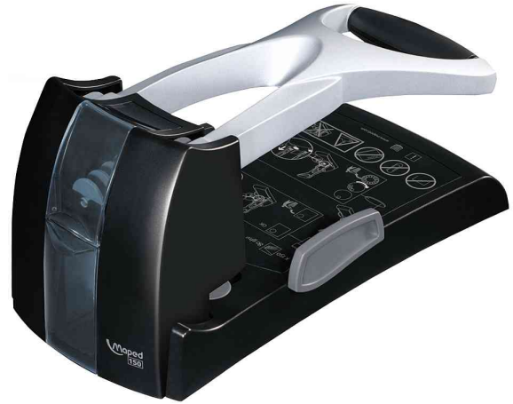
Registrierlocher Expert HD150