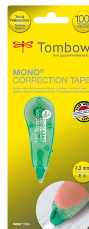
Korrekturroller "MONO CT-CCE4", grün