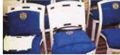
Dual Lock, Anwendungsbeispiele