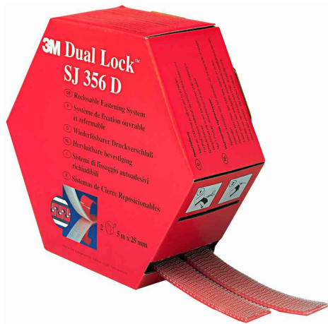
Dual Lock flexibler Druckverschluss SJ356D