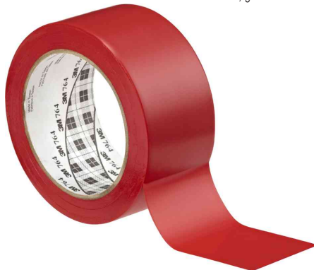
Allzweck-Weich-PVC-Klebeband 764I, rot