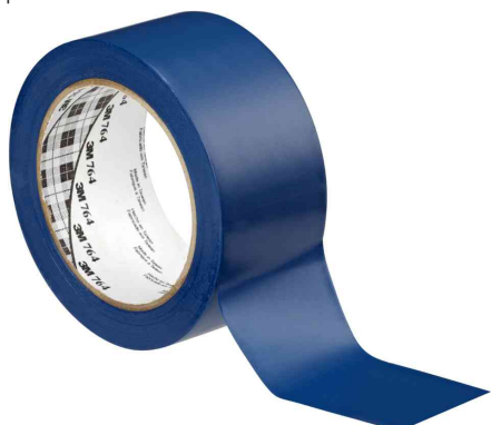
Allzweck-Weich-PVC-Klebeband 764I, blau