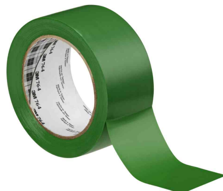
Allzweck-Weich-PVC-Klebeband 764I, grün