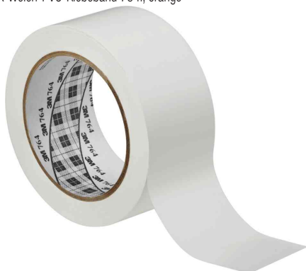
Allzweck-Weich-PVC-Klebeband 764I, weiß