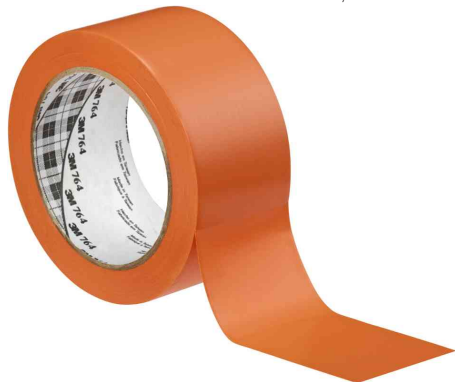
Allzweck-Weich-PVC-Klebeband 764I, orange