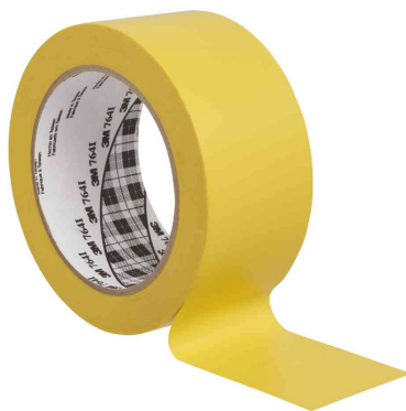
Allzweck-Weich-PVC-Klebeband 764I, gelb