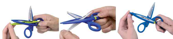
Konturenschere - einfaches Tauschen der Klinge