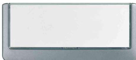
Türschilder Click Sign, graphit