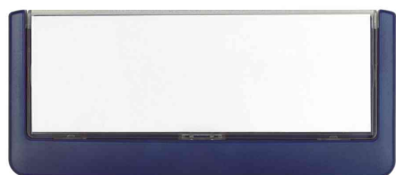
Türschilder Click Sign, blau