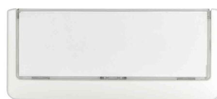
Türschilder Click Sign, weiß