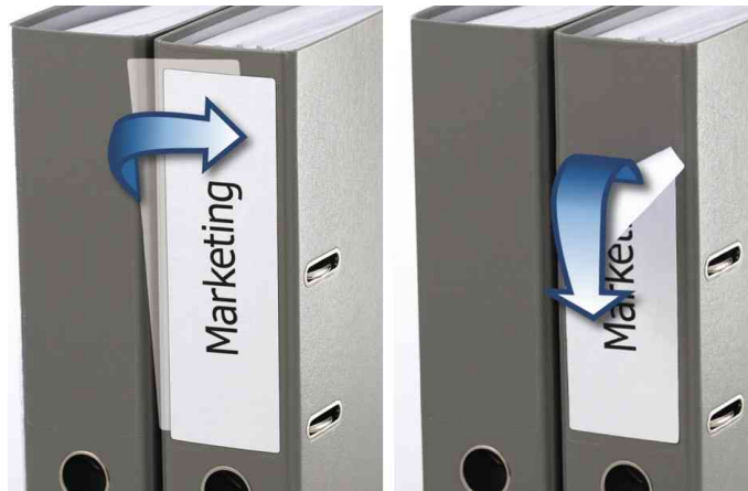
Orderrücken-Etiketten SPECIAL, Anwendung