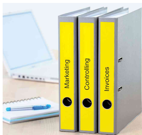
Orderrücken-Etiketten SPECIAL, Anwendung