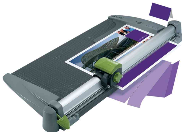
Rollen-Schneidemaschine SmartCut A535pro