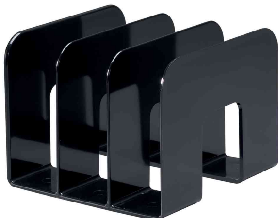
Buchstütze TREND, schwarz