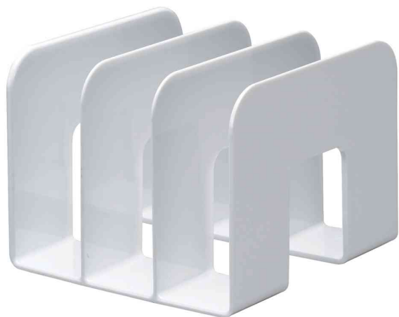
Buchstütze TREND, weiß