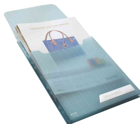
Sicht- / Prospekthülle CombiFile Maxi, offen