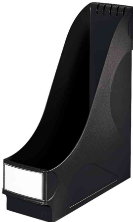
Stehsammler extrabreit, schwarz