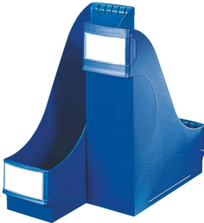
Stehsammler extrabreit, blau