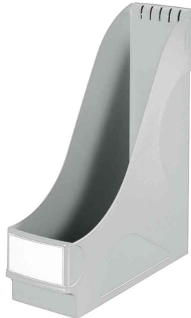
Stehsammler extrabreit, grau