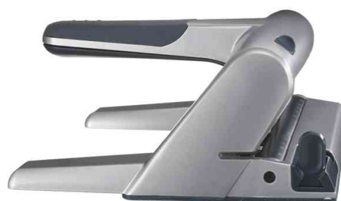
Mehrfachlocher AKTO, Griff-Niederhalter