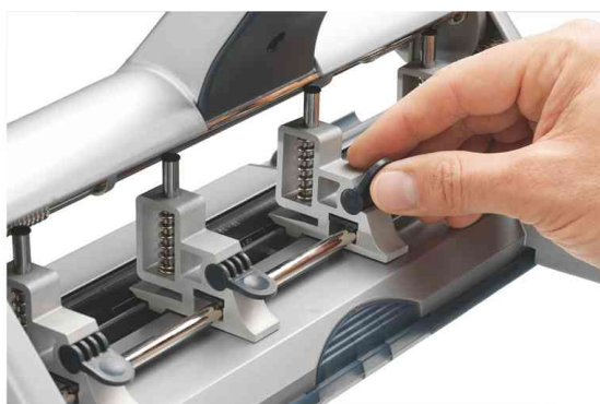
Mehrfachlocher AKTO, Lochsegmente einstellbar