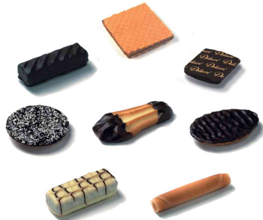
Treasure by Delacre, Einzelgebäck