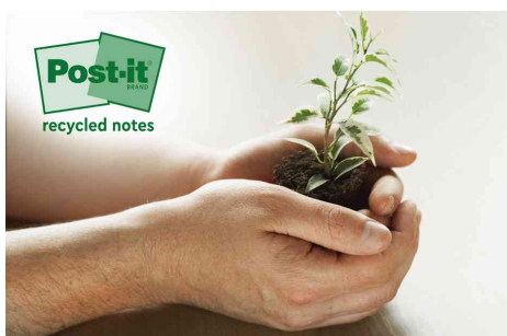
Klebstoff hergestellt aus nachwachsenden Rohstoffen