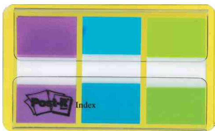
9006013: Haftmarker Index, lila/blau/grün