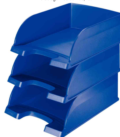
Zeigt das Produkt gestapelt