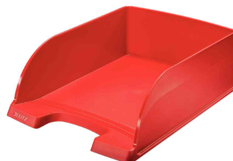
Briefablage Plus Jumbo, rot