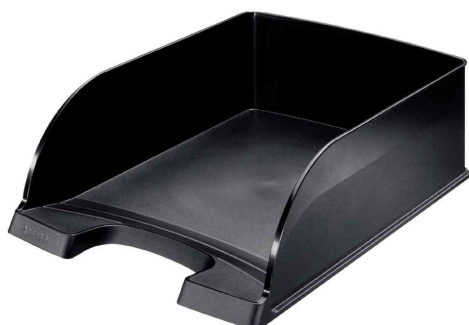
Briefablage Plus Jumbo, schwarz