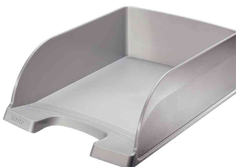
Briefablage Plus Jumbo, silber