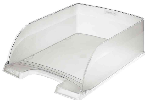
Briefablage Plus Jumbo, frost