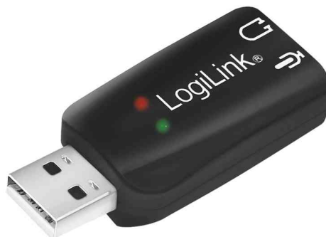
USB 2.0 Audioadapter, 5.1 Soundeffekt