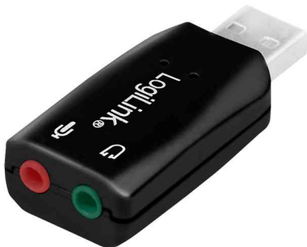
USB 2.0 Audioadapter, 5.1 Soundeffekt