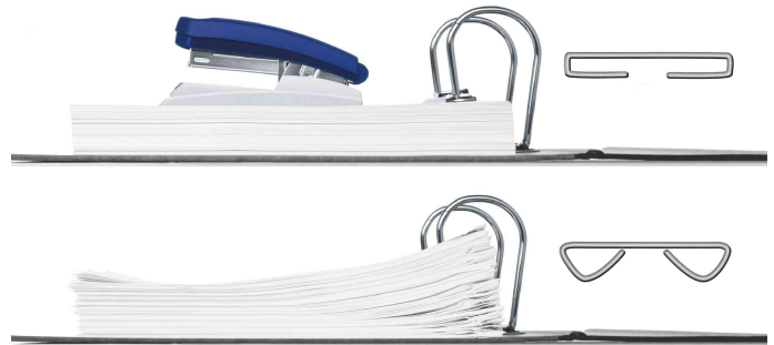
Flachhefttechnologie spart 30% Platz