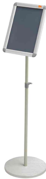
Infoständer, DIN A4