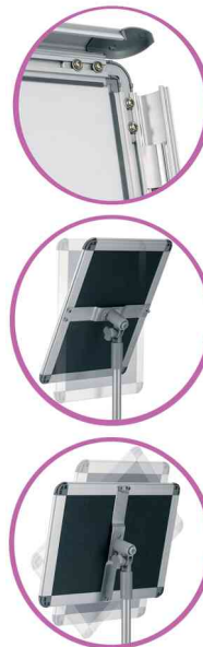
hochklappbare Rahmen - verstellbarer Winkel - Hoch- oder Querformat einstellbar