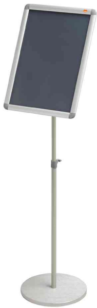
Infoständer, DIN A3