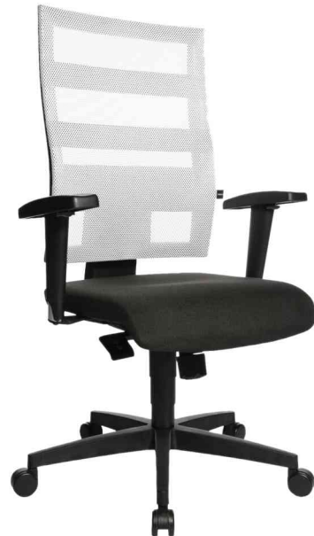
Bürodrehstuhl "X-Pander", schwarz/weiß mit optionaler Armlehne Typ T2