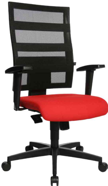
Bürodrehstuhl "X-Pander", rot mit optionaler Armlehne Typ T2