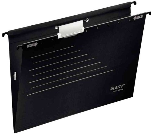
ALPHA Active Hängemappe, schwarz