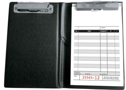
Kassenblock-Mappe mit Kassenblock