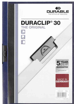
Klemmhefter DURACLIP® Original 30, nachtblau