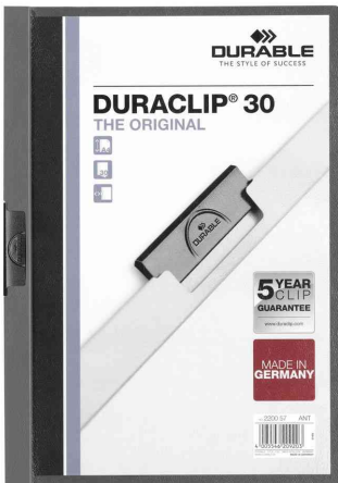
Klemmhefter DURACLIP® Original 30, anthrazit