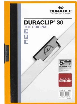
Klemmhefter DURACLIP® Original 30, orange