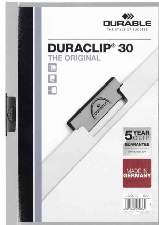
Klemmhefter DURACLIP® Original 30, grau