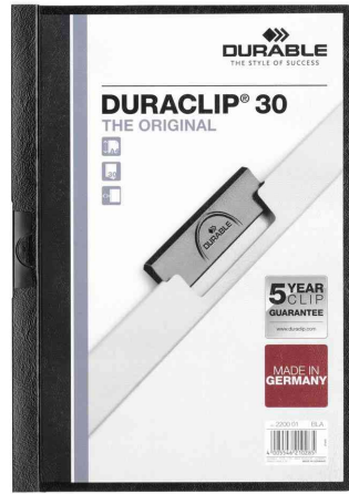
Klemmhefter DURACLIP® Original 30, schwarz