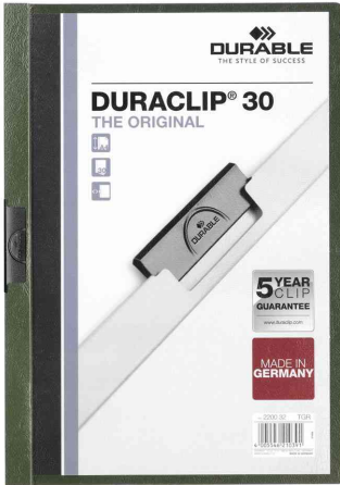
Klemmhefter DURACLIP® Original 30, petrol