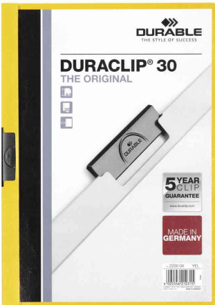
Klemmhefter DURACLIP® Original 30, gelb