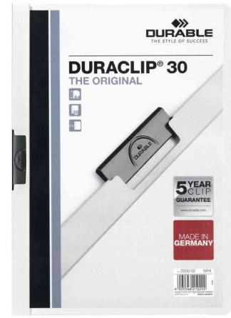
Klemmhefter DURACLIP® Original 30, weiß