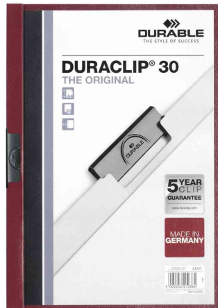
Klemmhefter DURACLIP® Original 30, aubergine