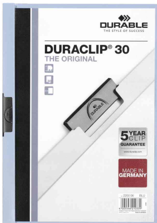
Klemmhefter DURACLIP® Original 30, hellblau