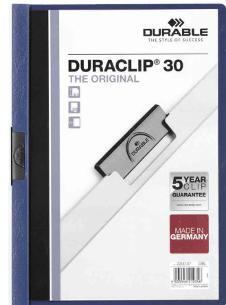
Klemmhefter DURACLIP® Original 30, dunkelblau