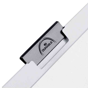
Herausziehbare, schwarze Klemme